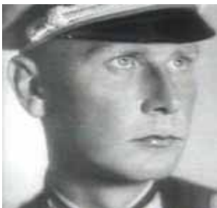
Major Axel von dem Bussche (1919-93), 1944

Die 4000 Seiten im Internet spiegeln die Bedeutung der "Bussches" wieder, die sich als Landwirte, Staatsbeamte und Militärs ausgezeichnet haben, neuerdings auch als Gelehrte und Künstler. Wir finden aus der Ippenburger Linie: einen Minister in Hannover, einen Gesandten in Wien, eine Hofdame der Königin von Hannover, eine Oberin eines Diakonissenhauses; aus der Linie Haddenhausen: einen hannoverschen Landdrost, einen hannoverschen General; aus der Hünnefeld-Streithorster Linie: einen Oberstleutnant, einen Staatsminister zu Hannover und einen Major aus dem 2. Weltkrieg, der hier besonders gewürdigt werden soll.