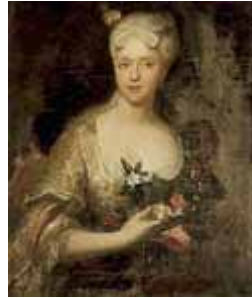
Gemälde "Frau von dem Bussche" des preussischen Hofmalers Antoine Pesne, von 1719 (wahrscheinlich eine der 4 Töchter des Generals Johann von dem Bussche 1642-93)