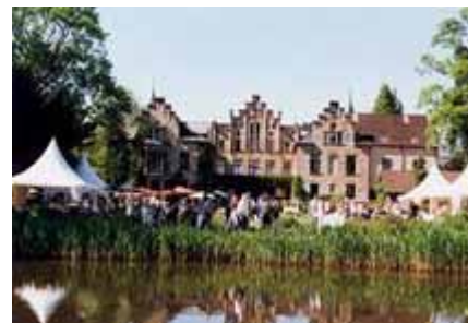
Einmal im Jahr: Gartenfestival auf Schloss Ippenbürg bei Bad Essen

Mit Blick auf das große Betätigungsfeld des Familienverbandes von dem Bussche war das Land Lippe jedoch nur ein Nebenschauplatz. Im Zusammenhang mit den ihnen überall anvertrauten Lehnsgütern hatten sich an vielen Orten neue Familiensitze entwickelt; im 19. Jahrhundert waren schon 7 Hauptlinien bekannt, die sich von ihrem Ausgangspunkt Osnabrück über Lippe und Ravensberg auf