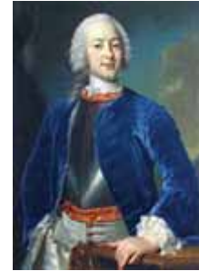
Gemälde "Johann Clamor Freiherr von dem Bussche" des hannoverschen Hofmalers Johann Georg Ziesenis, um 1765

Die 4000 Seiten im Internet spiegeln die Bedeutung der "Bussches" wieder, die sich als Landwirte, Staatsbeamte und Militärs ausgezeichnet haben, neuerdings auch als Gelehrte und Künstler. Wir finden aus der Ippenburger Linie: einen Minister in Hannover, einen Gesandten in Wien, eine Hofdame der Königin von Hannover, eine Oberin eines Diakonissenhauses; aus der Linie Haddenhausen: einen hannoverschen Landdrost, einen hannoverschen General; aus der Hünnefeld-Streithorster Linie: einen Oberstleutnant, einen Staatsminister zu Hannover und einen Major aus dem 2. Weltkrieg, der hier besonders gewürdigt werden soll.