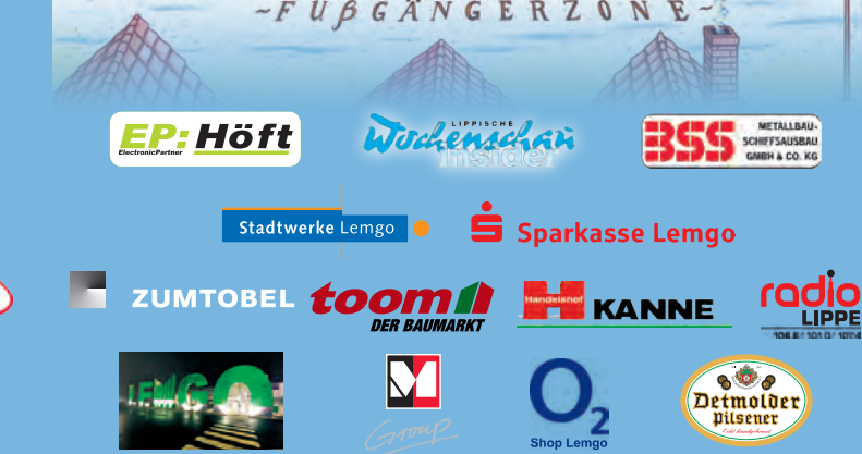
Illustration: Michael Cräper | Gestaltung und Produktion: Büro für Design. Emrich [www.designlog.de] | Druck: Strohmeier Medien